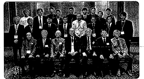
令和5年11月11日 久しぶりに集えた参加者